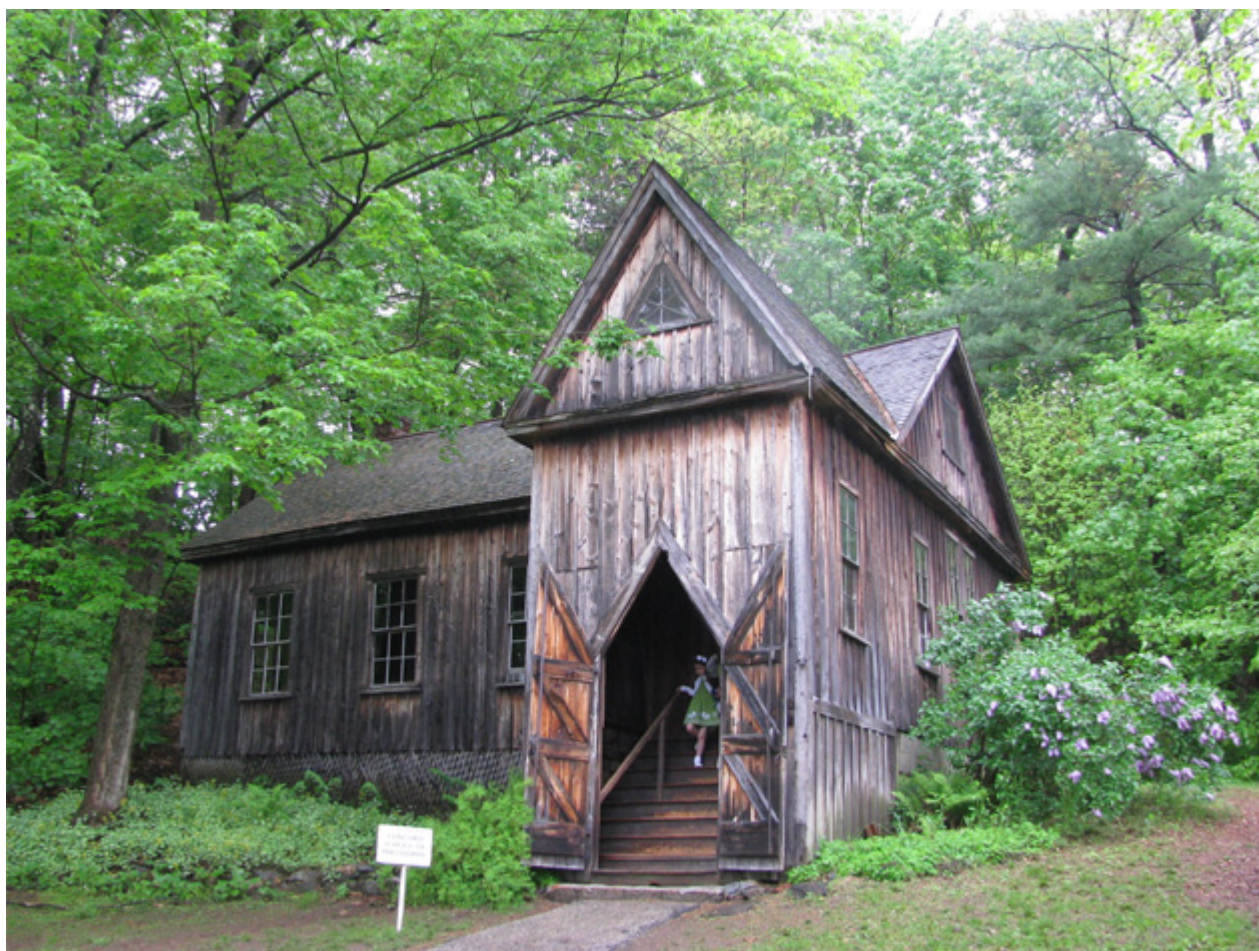
The Amos Bronson Alcott School of Philosophy

anche per alleviare il lavoro domestico delle donne. L'esperimento di Fruitlands , strutturato in modo aleatorio (Alcott e compagni non brillavano quanto a organizzazione e senso pratico), risultò di breve durata, anche per difficoltà economiche, accentuate dal cattivo raccolto del primo anno.