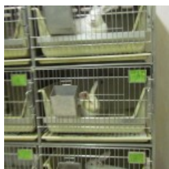
fgh farmacologia aprile 2013 3