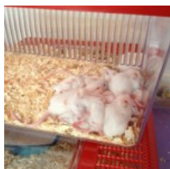
fgh farmacologia aprile 2013 1c