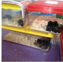
fgf farmacologia aprile 2013 1b