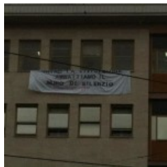
fgf farmacologia aprile 2013 6