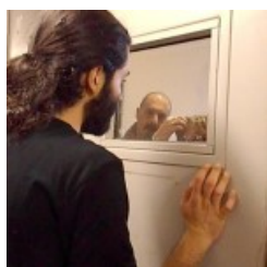
fgh farmacologia aprile 2013 2