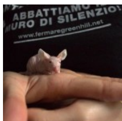
fgh farmacologia aprile 2013 1a

Di seguito una galleria fotografica della giornata.