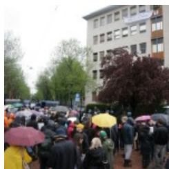
fgh farmacologia aprile 2013 1