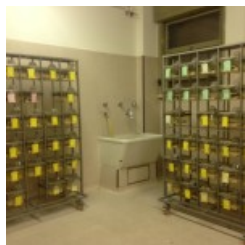
fgf farmacologia aprile 2013 5