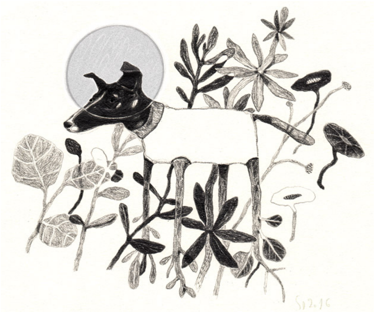
Illustrazione di Simona Dimitri