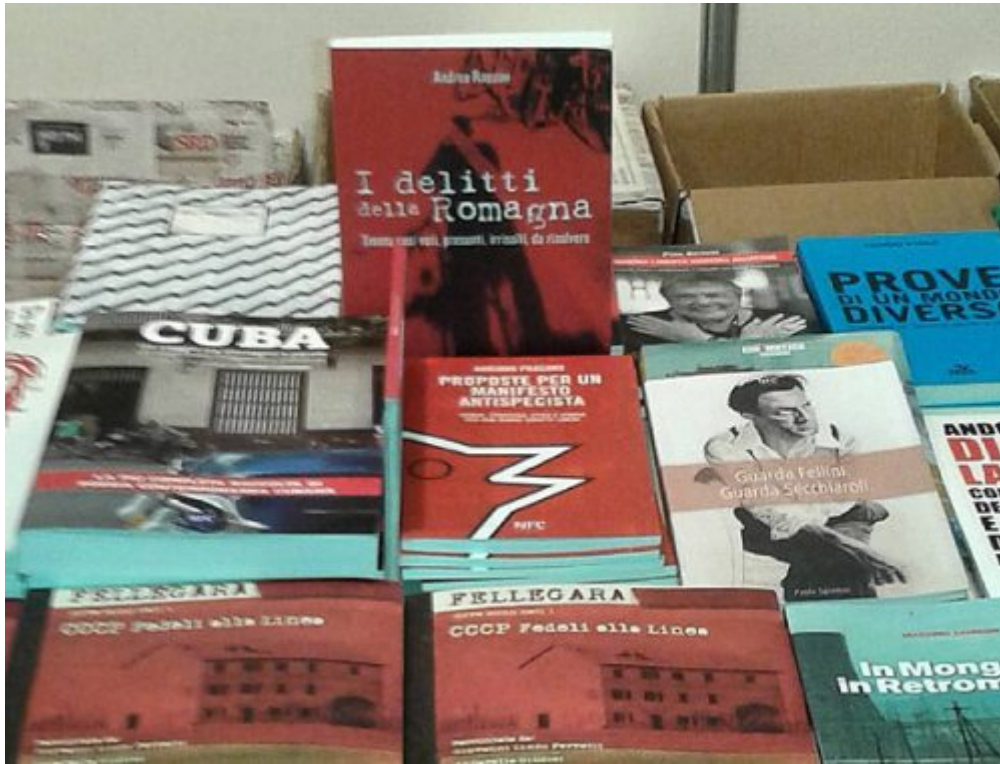
fiera nazionale piccola e media editoria roma 2016

Il libro un anno dopo: più di 2.100 copie distribuite