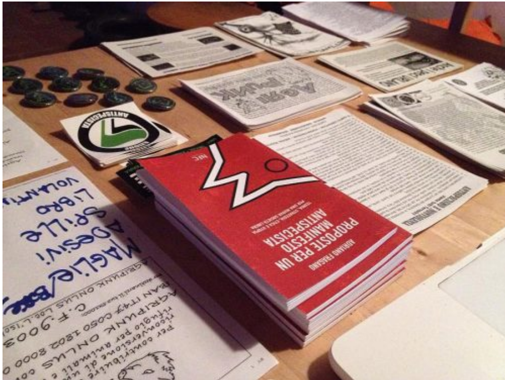
agripunk toscana ma

Il libro un anno dopo: più di 2.100 copie distribuite