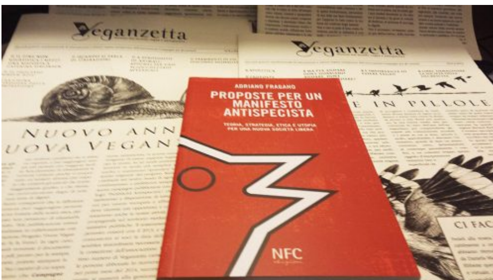
gb tino verducci ma