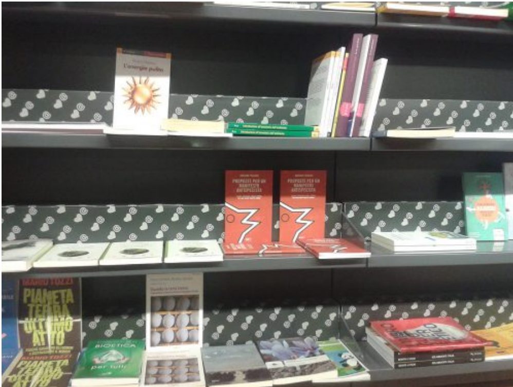
libreria lovat treviso ma

Il libro un anno dopo: più di 2.100 copie distribuite